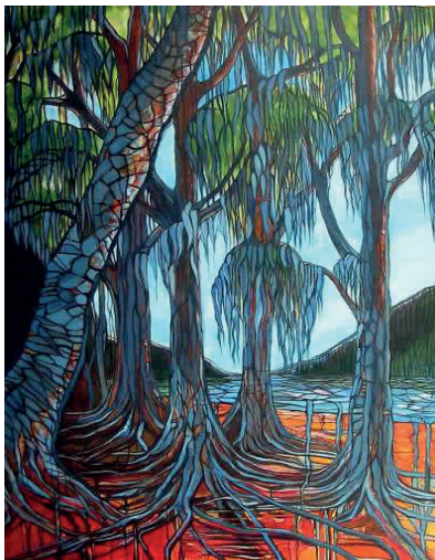
El Bosque Encantado, óleo, 90 x 60

sus herramientas y maquinaria y se trasladó a la Octava Región. Allí hizo clases de todo: country, resina, cerámica, alemán. Con esos cursos y su trabajo como decoradora de interiores financiaba sus telas y pinturas.