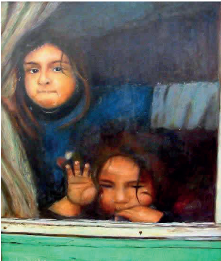
La soledad, óleo, 40 x 50

Al color llegó por un hecho triste: la muerte de su padre. “Mi viejo siempre me decía ‘pinta a color’ y tuvo que morir para que le hiciera caso. Y fue precisamente aquí en Niebla, yo es-