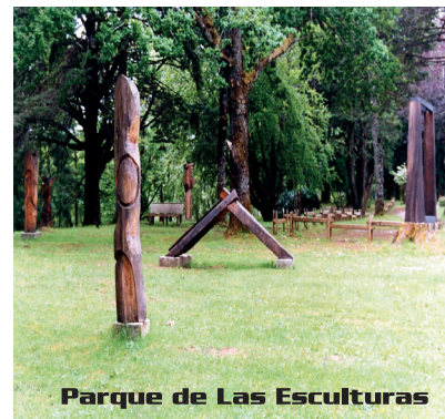
Parque de Las Esculturas

Parque de las Esculturas. 25 esculturas contemporáneas de gran formato en piedra, metal y madera, de artistas chilenos y extranjeros, ubicadas al aire libre y rodeadas por un bello entorno natural, junto a la Laguna de los Lotos. (Parque Saval, Isla Teja / sólo se paga entrada al Parque Saval)