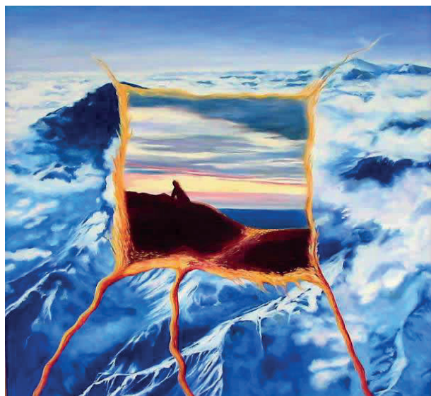
Convergencia Serie II, óleo, 100 x 100